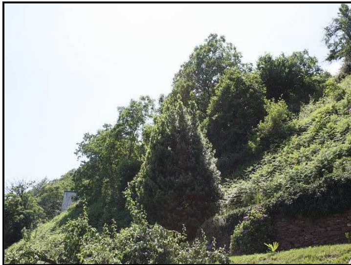
Terreno sopra / Bauland oben