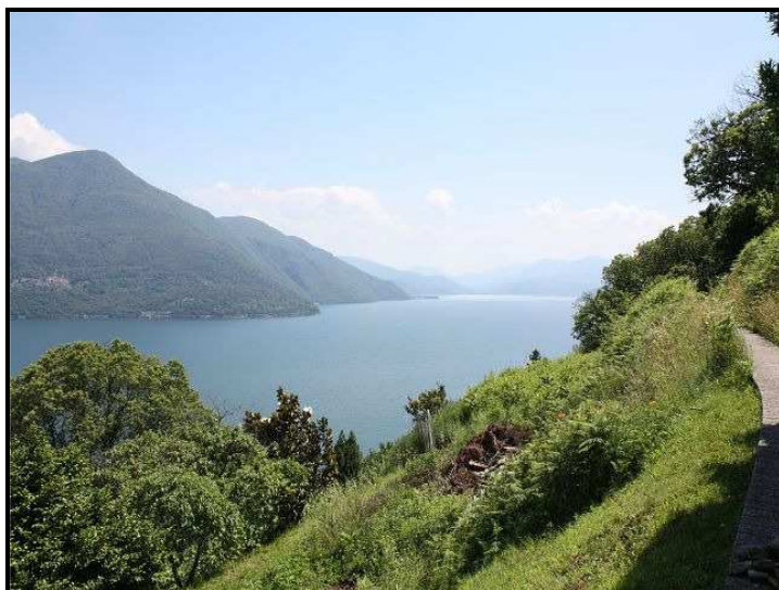
Terreno con vista sud / Bauland mit Südblick