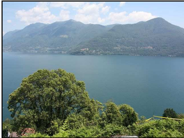
Vista sud-est / Südostblick