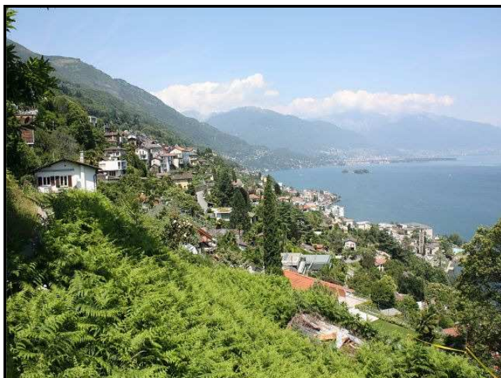
Terreno sotto con Brissago / Bauland unten mit Brissago