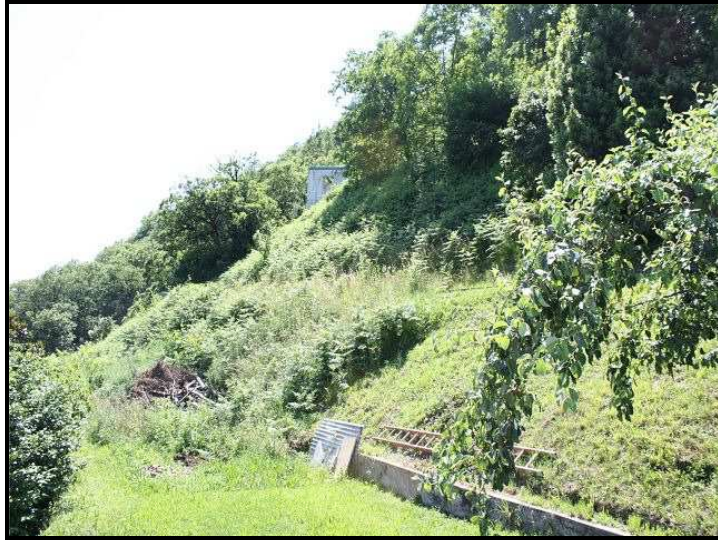
Terreno / Bauland