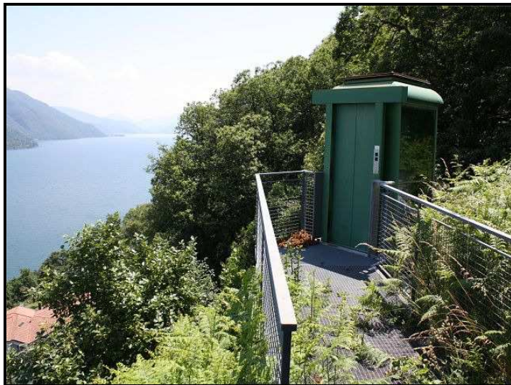
Funiculare / Mittelstation