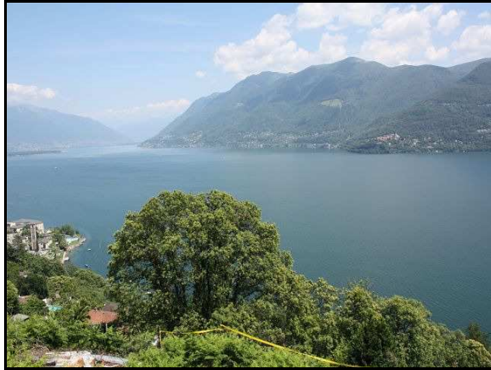
Vista est / Ostblick