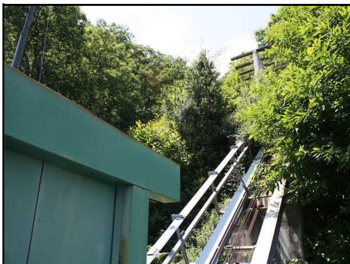
Funiculare / Bergstation