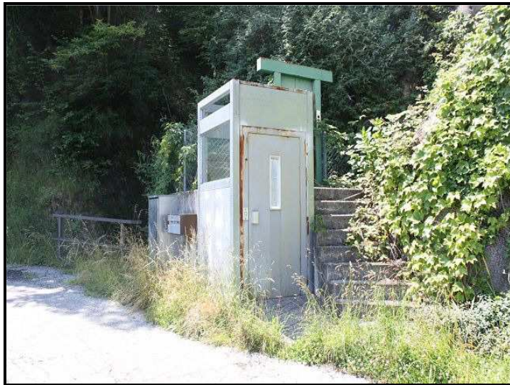
Funiculare / Talstation