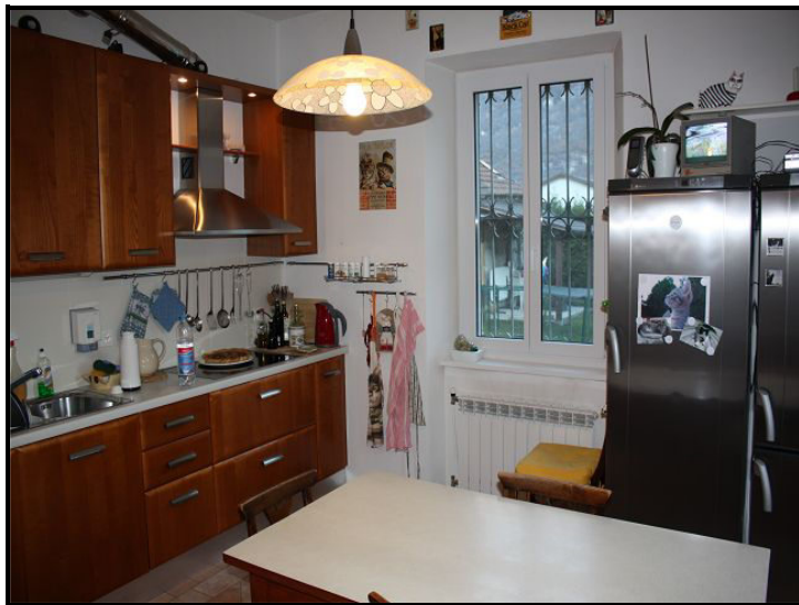
Cucina / Wohnküche