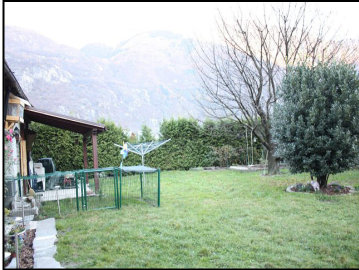
Giardino / Garten