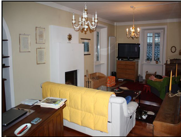
Soggiorno / Wohnraum