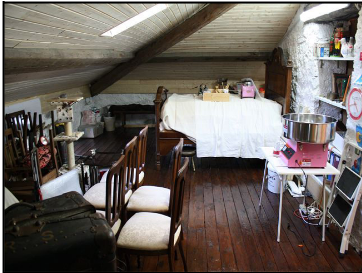
Camera sotto tetto / Dachzimmer