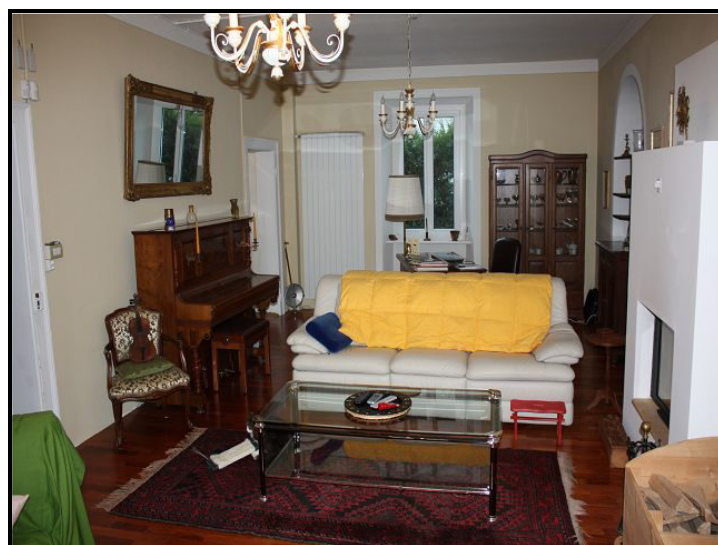
Soggiorno / Wohnraum