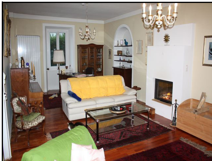
Soggiorno / Wohnraum