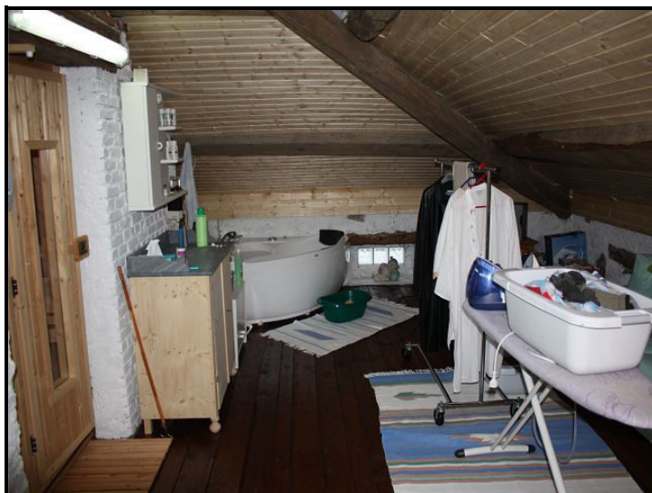
Camera sotto tetto con sauna / Dachzimmer mit Sauna