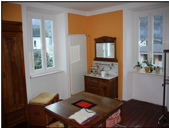
Camera / Zimmer