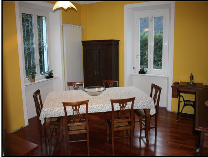
Pranzo / Essraum