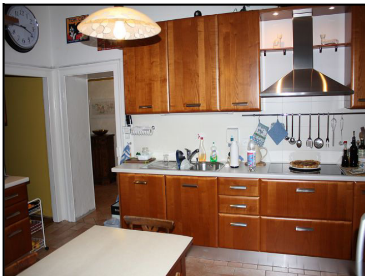
Cucina / Wohnzimmer