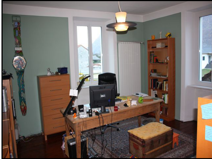
Camera / Zimmer