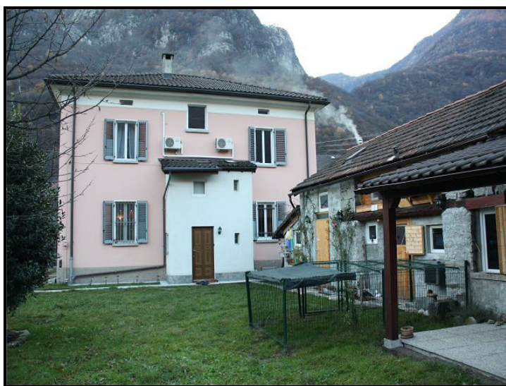
Casetta e facciata est / Nebengebäude mit Ostfassade