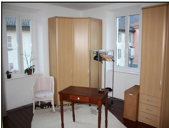
Camera / Zimmer