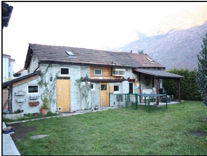
Casetta a parte / Nebengebäude