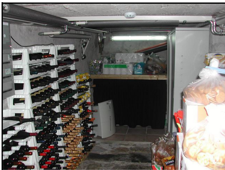
Cantina / Weinkeller