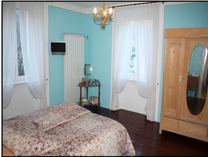
Camera / Schlafzimmer