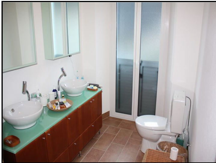
Doccia / Dusche