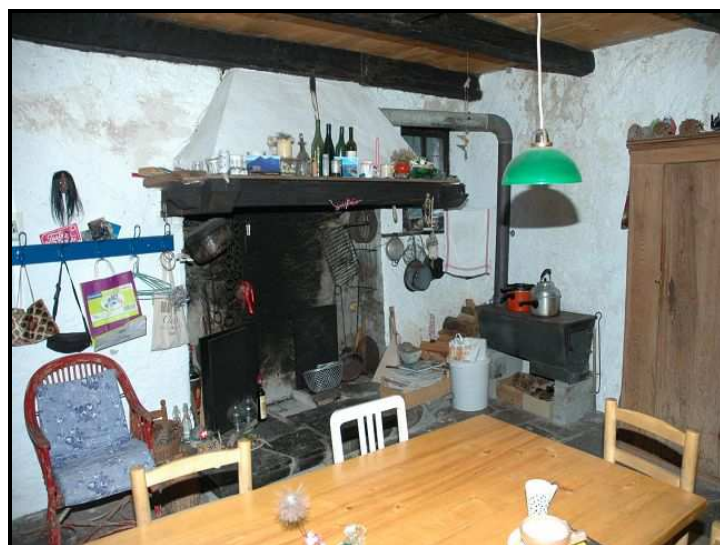
Camino / Kamin