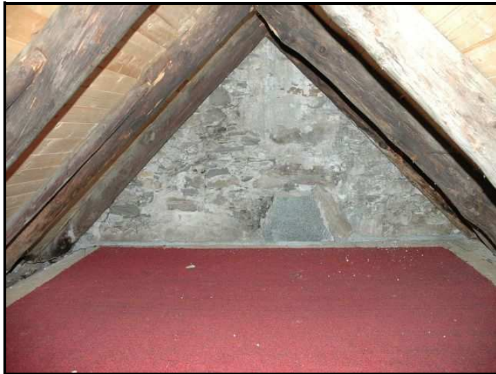
Mansarda / Dachraum