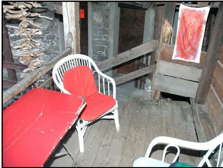
Cortile davanti la cucina / Sitzplatz vor Küche