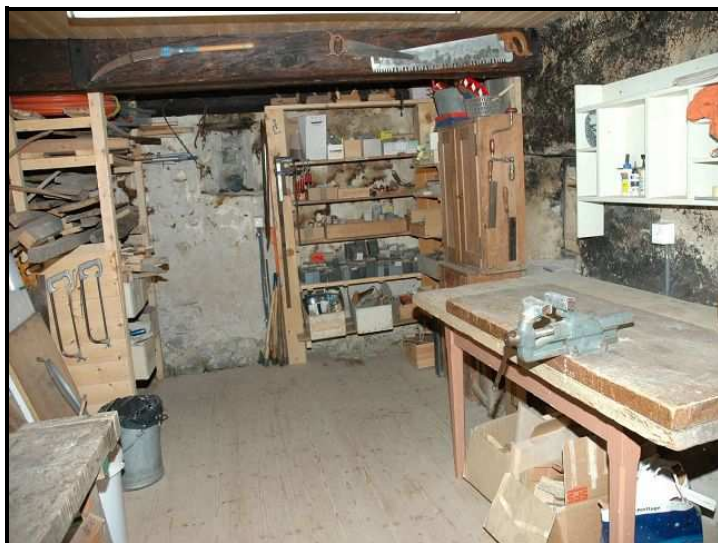
Sala hobby / Werkstatt