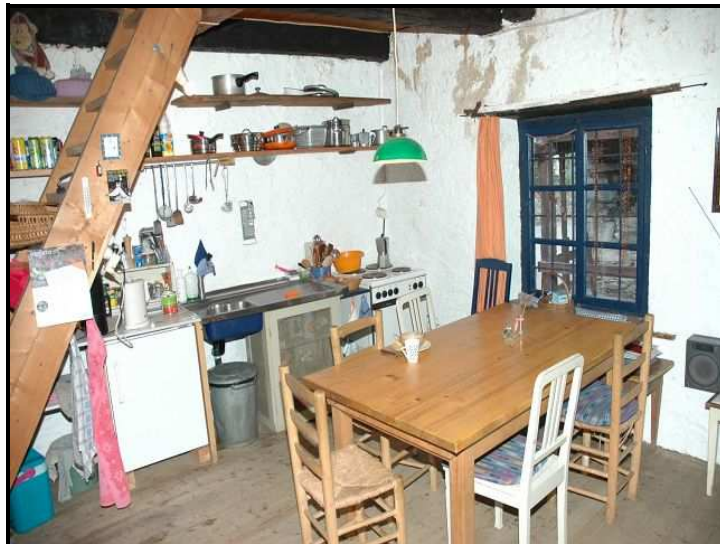
Cucina / Küche