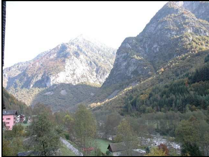
Vista verso nord / Nordblick