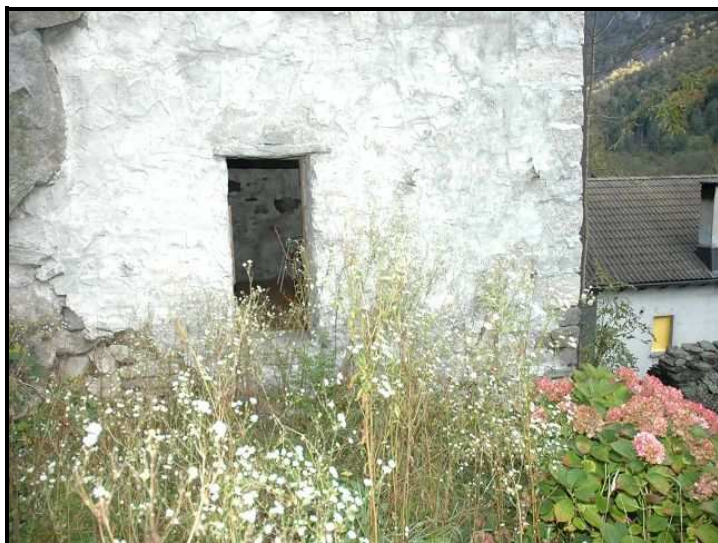
Giardinetto / Gärtchen