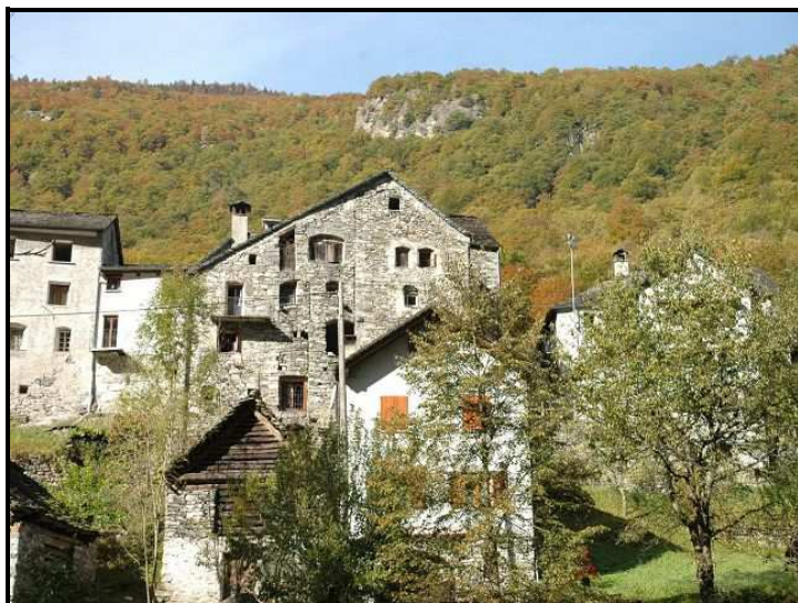
Casa / Haus