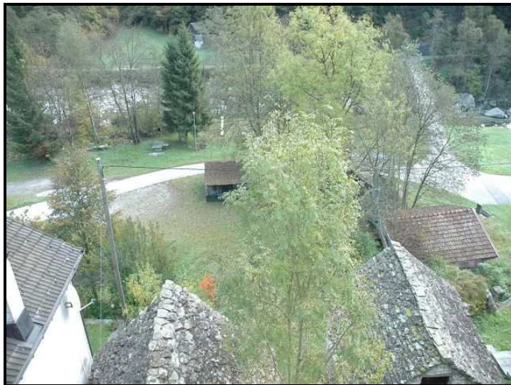
Vista verso fiume / Blick zum Fluss