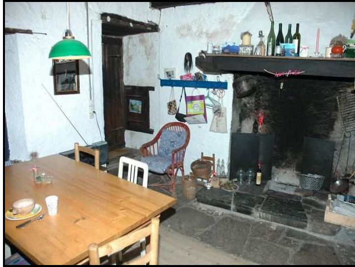
Soggiorno / Pranzo / Wohn-/Essraum