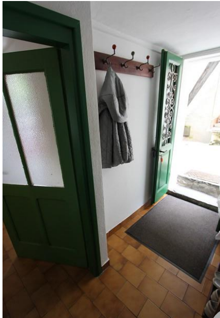
Eingang, Wohn-/Essbereich mit Küche ● entrata, soggiorno, pranzo e cucina