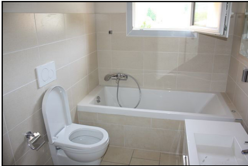
Bagno / Bad