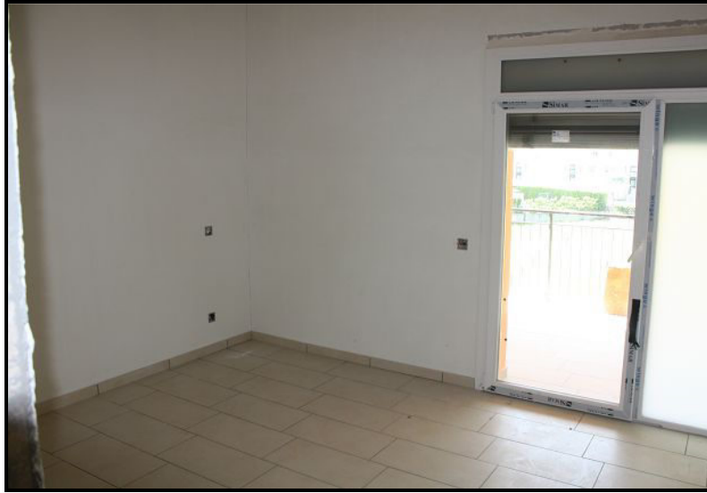
Camera / Zimmer