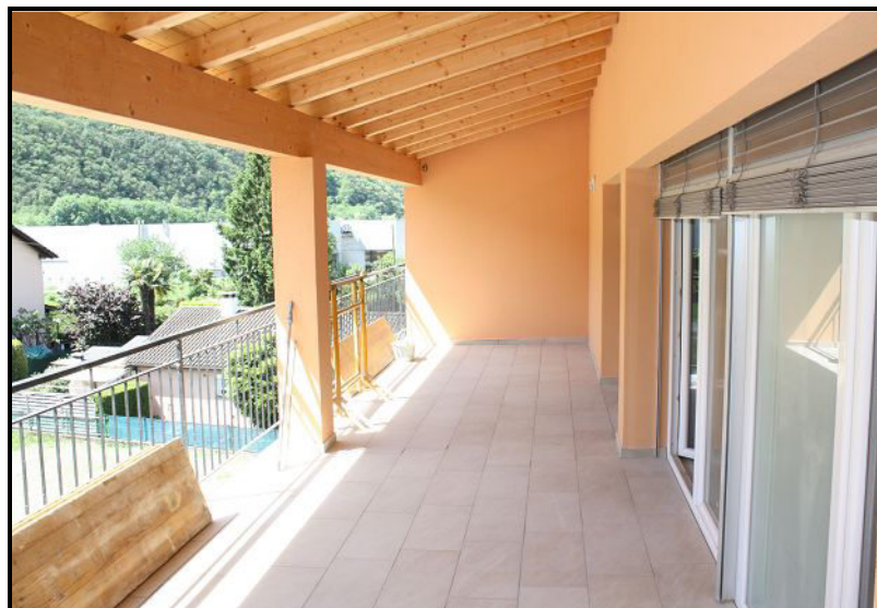
Terrazza / Terrasse