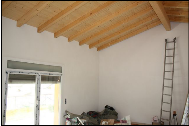
Soggiorno / Wohnraum