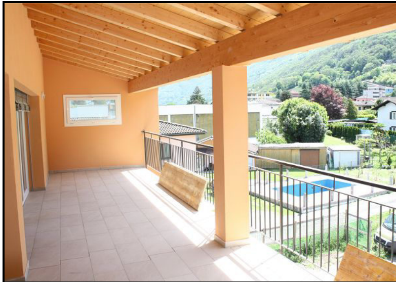
Terrazza / Terrasse