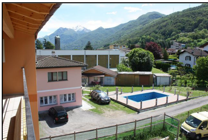
Vista est / Ostblick