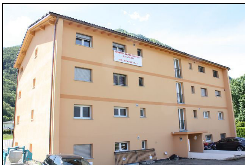
Entrata / Eingang