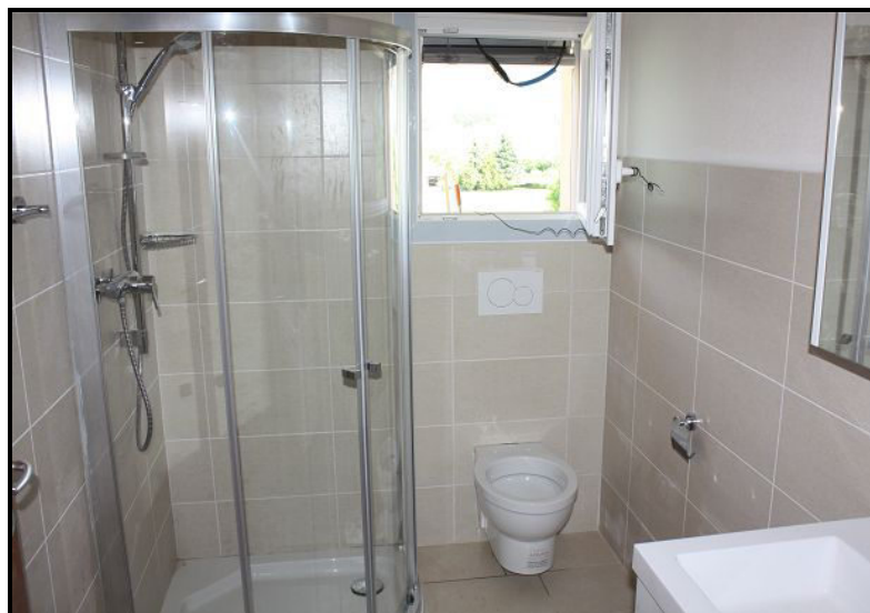
Doccia / Dusche