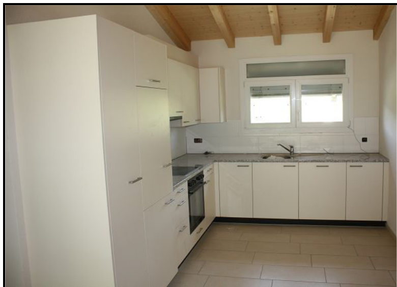
Cucina / Küche