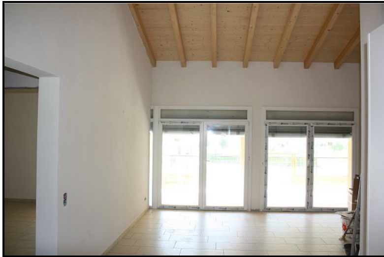
Pranzo / Essbereich