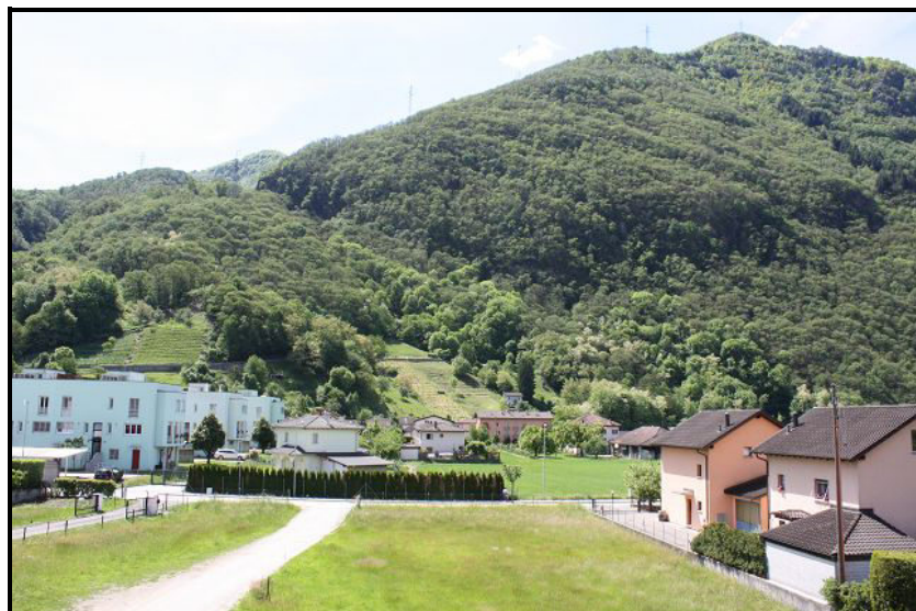
Vista sul Monte Tamero / Blick auf Tamaro