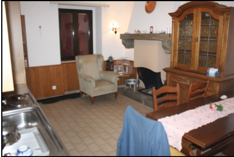
Grotto: Soggiorno / pranzo / Cucina nel PT / Grotto: Wohn-/Essraum mit Küche im EG