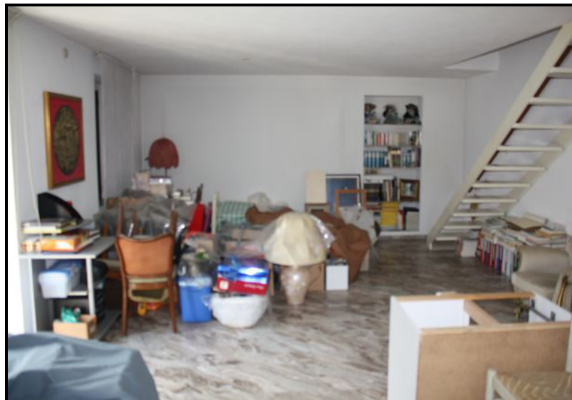
Soggiorno nel duplex / Wohnraum in der Maisonette-Wohnung