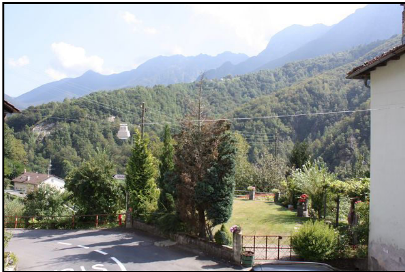
Vista sud-est / Südostblick