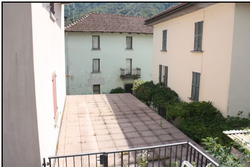
Terrazza / Westterasse