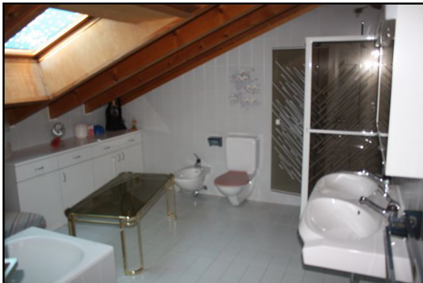
Doccia nella mansarda / Dusche im Dachgeschoss