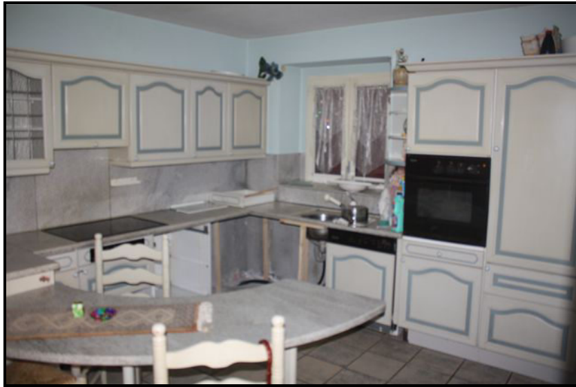
Cucina abitabile / Wohnküche