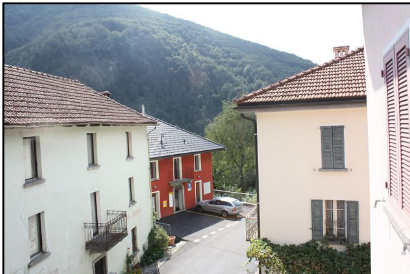
Vista sudovest / Südwestblick