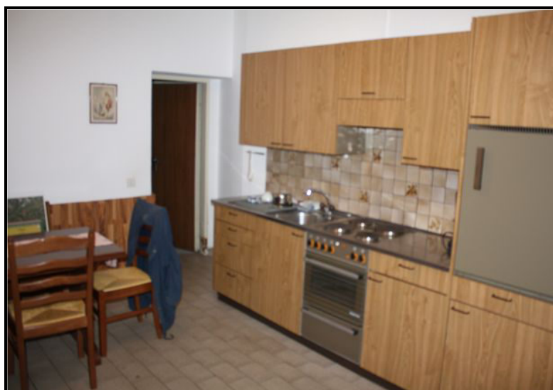
Cucina / Küche