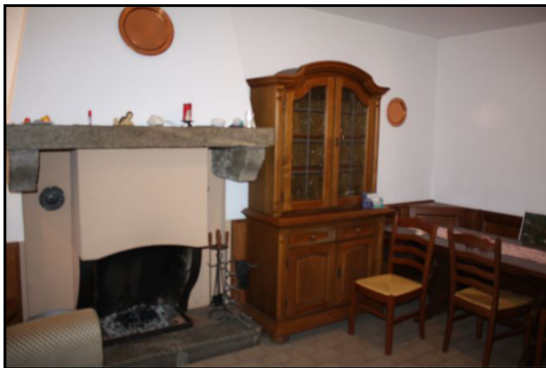
Grotto: Soggiorno / pranzo / Cucina nel PT / Grotto: Wohn-/Essraum mit Küche im EG