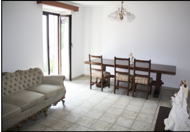
Soggiorno / pranzo nel primo piano / Wohn-/Essraum im 1. OG