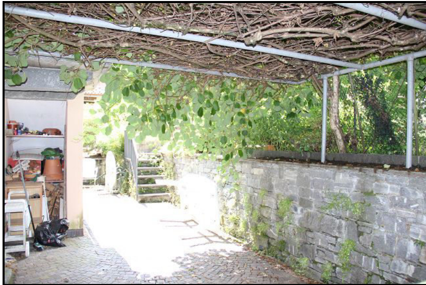
Cortile / hinterer Sitzplatz