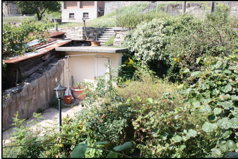
Giardino / Garten