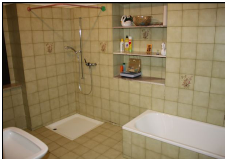
Bagno/doccia nel primo piano / Bad/Dusche im 1. OG