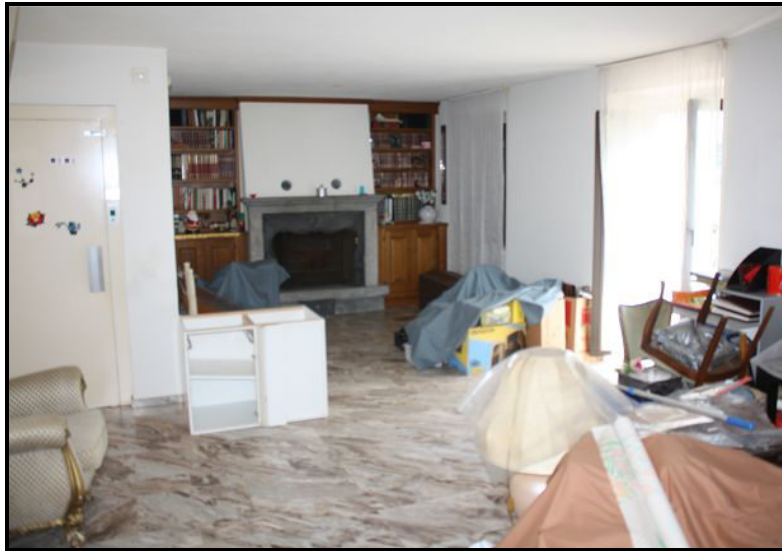
Soggiorno nel duplex / Wohnraum in der Maisonette-Wohnung