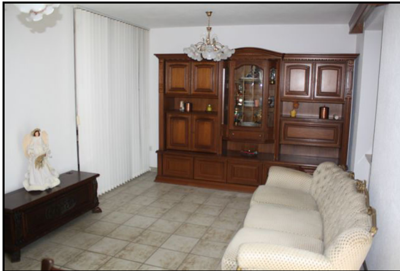
Soggiorno / pranzo nel primo piano / Wohn-/Essraum im 1. OG