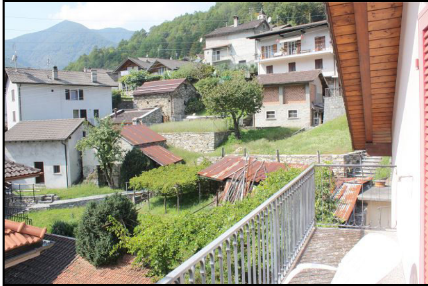
Balcone e vista ovest / Balkon mit Westblick